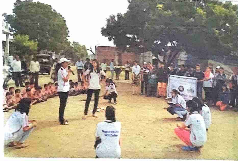
रा.से.यो च्या विद्यार्थीनी श्रमदान व पथनाट्य सादर करतांना