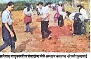
राष्ट्रीय सेवा योजनेच्या अंतर्गत रासेयो श्रमसंस्कार शिबिराचे उद्घाटन महिला महाविद्यालयाच्या प्राचार्यांच्या हस्ते झाले. शिबिरातून मिळणारे श्रमदानाचे महत्त्व प्राचार्यांनी सांगितले.