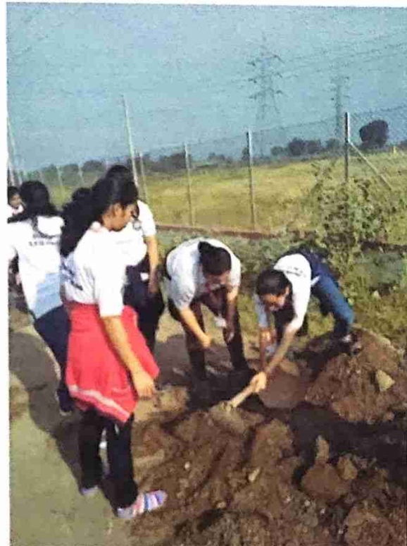
रा.से.यो च्या स्वयं सेविका शोष खडे व रस्ता डागडुगी करतांना