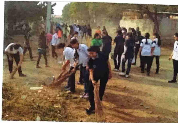
ग्राम स्वच्छता करतांना रासेयोच्या स्वयं सेविका